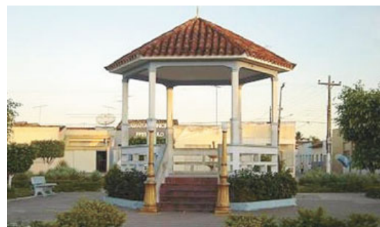
Este é o coreto de Frei Paulo (SE), um dos cartões postais da cidade onde nasceu Ancelmo Gois. Tudo acontecia ali, inclusive o encontro de grandes amores nos passeios de domingo, quando as mocinhas andavam em volta do coreto. Já naquela época, 40 anos atrás ou mais, esse inocente passeio dominical era chamado de footing. Fica na Praça Capitão João Tavares, mais conhecida como Praça do Coreto.

Nesses tempos Ancelmo também ia à missa. Seu avô por parte de pai morreu cedo e seu pai foi criado por um padre. “A nossa família é